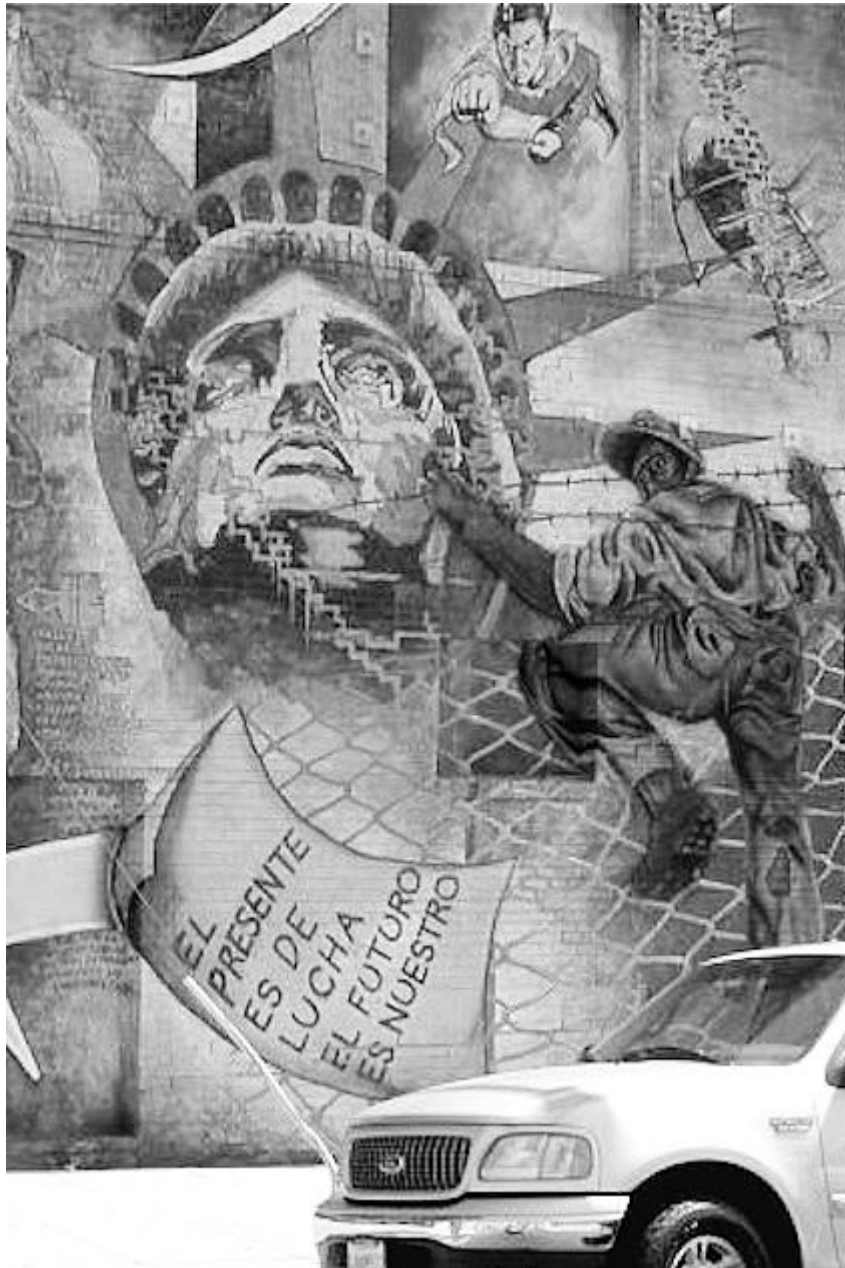
Colectivo de grafistas latinos , Fragmento del mural “ One Stop Immigration and Educational Center ”, Los Ángeles, 1999-2002

Document d'origine en couleur (tonalités de bleu, gris et jaune pâle). Les larmes de la Statue de la Liberté sont des larmes de sang.