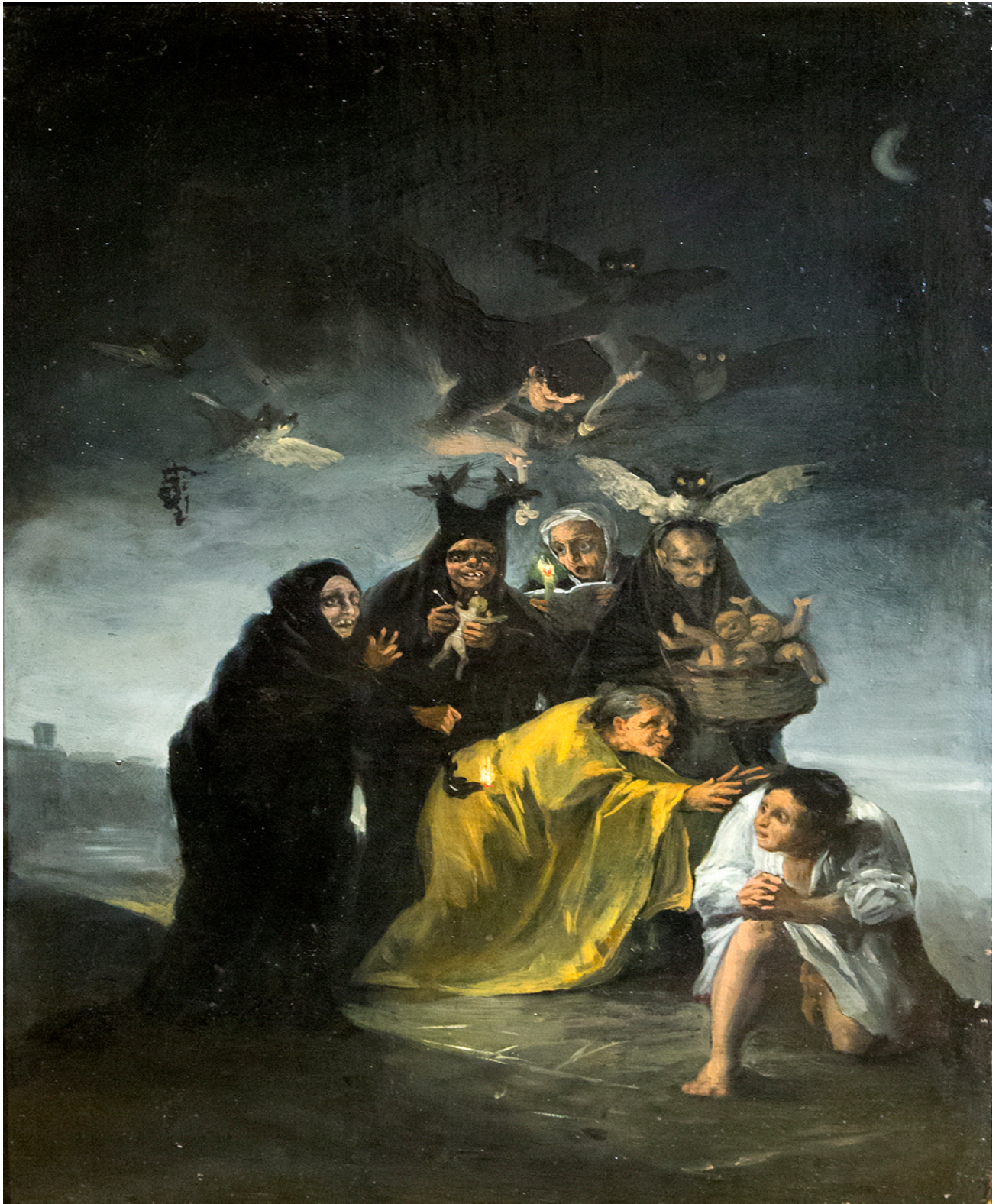
Francisco de Goya y Lucientes (pintor español), El Conjuero 1 o Las brujas , 1798.