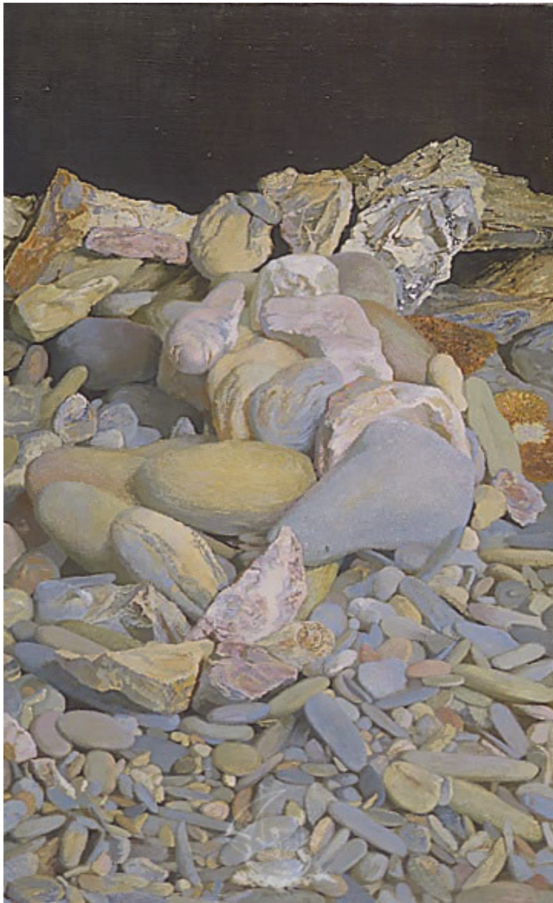
Antoni PITXOT (pintor español), Playa Dormida , 1974

Document d'origine en couleur (tonalités de gris, de beige et de rose pâle).