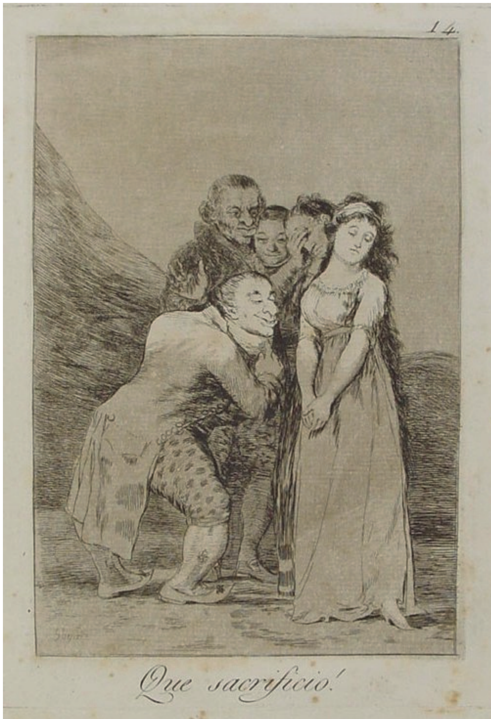
Francisco DE GOYA, ¡Qué sacrificio! , grabado de la serie Los Caprichos , 1799

la joroba: la bosse el jorobado: le bossu