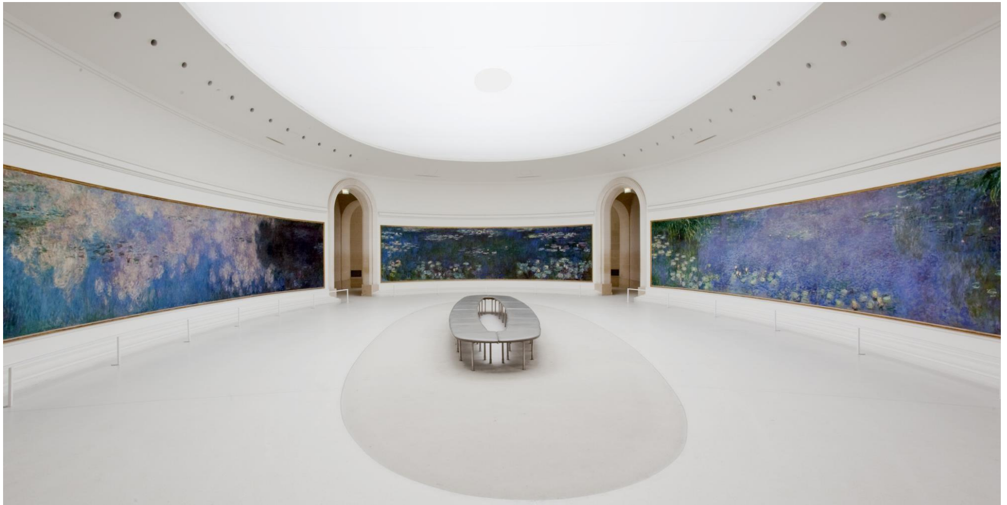
Claude MONET, Cycle des Nymphéas du musée de l'Orangerie , entre 1897 et 1926, huile sur toile, H. : 1,97 m, L. : environ 100 m linéaires, surface environ 200 m 2 . Musée de l'Orangerie, Paris, France.