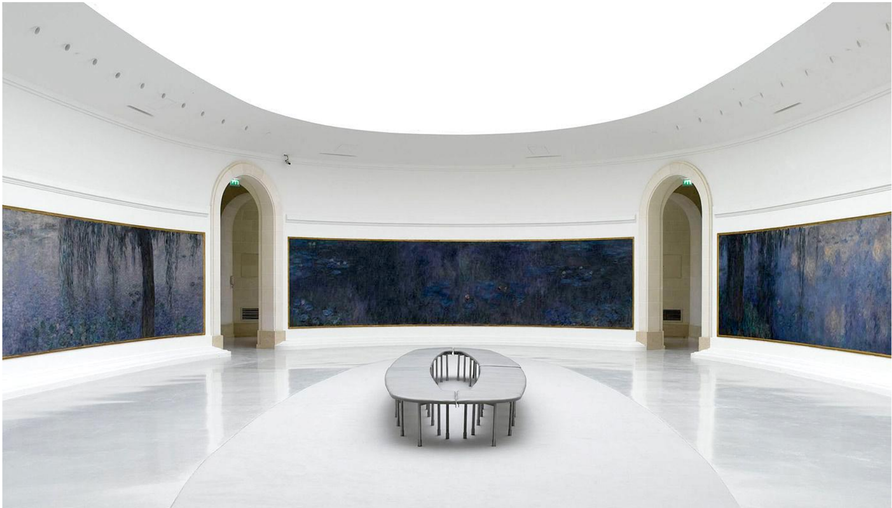
Claude MONET, Cycle des Nymphéas du musée de l'Orangerie , entre 1897 et 1926, huile sur toile, H : 1,97 m, L : environ 100 m linéaires, surface environ 200 m 2 . Musée de l'Orangerie, Paris, France.