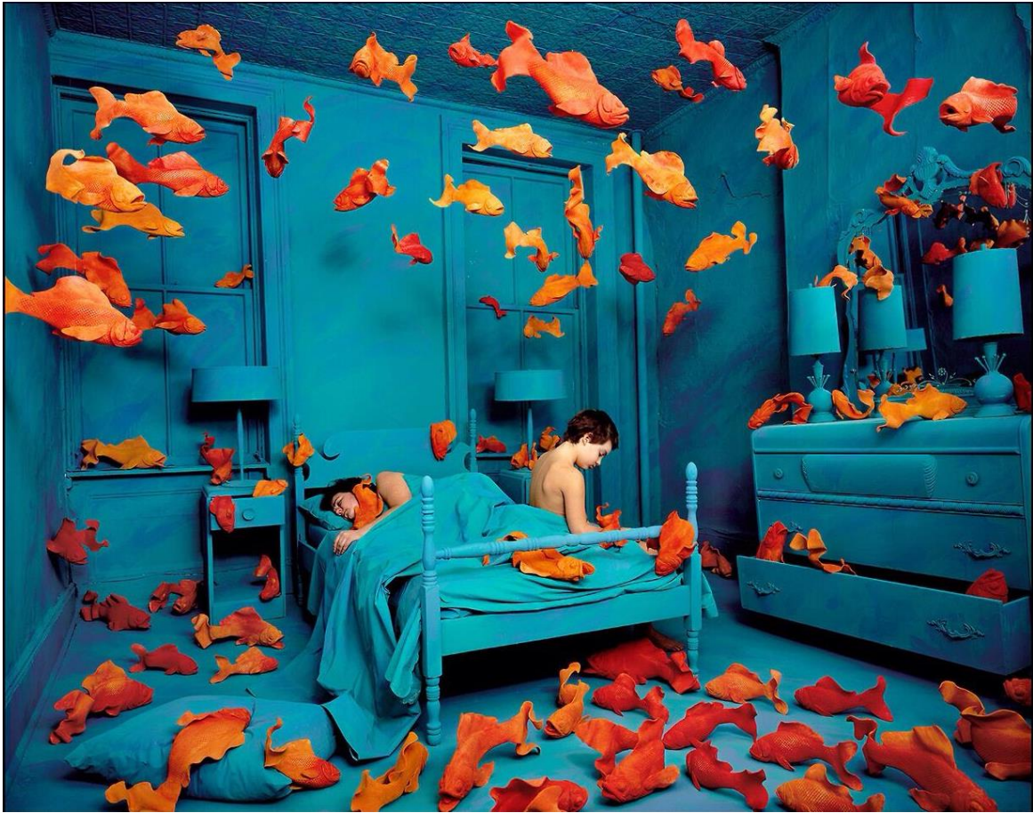
Sandy SKOGLUND, Revenge of the Goldfish (La revanche des poissons rouges) , 1981. Photographie couleur, tirage Cibachrome, 65 x 83 cm. Collection du FRAC Lorraine, Metz, France.

L'espace de la pièce a été entièrement peint ; Sandy Skoglund a réalisé les poissons en terre cuite, qu'elle a ensuite disposés dans l'installation pour en faire la photographie.