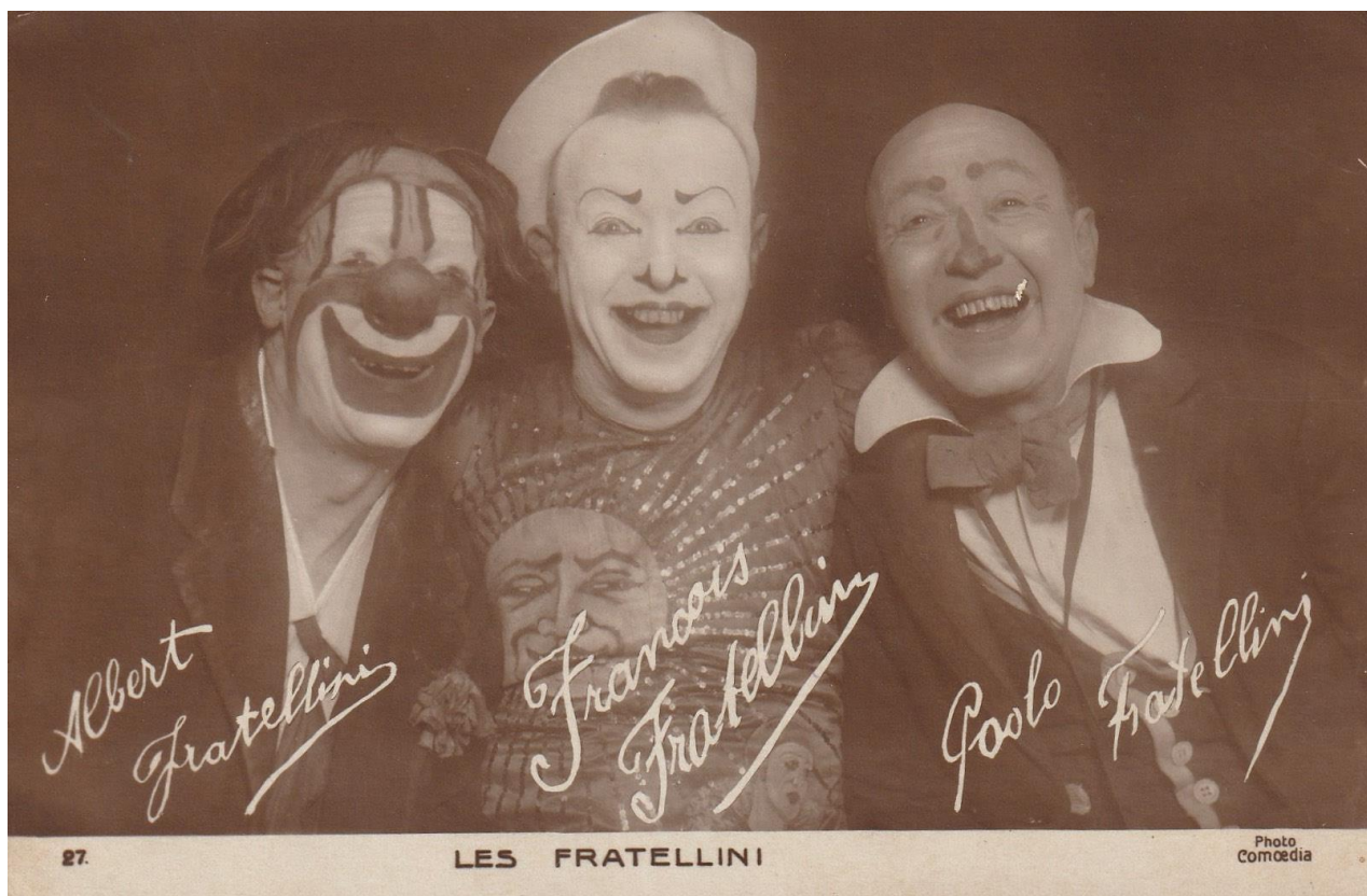
Les Fratellini, carte postale n°27, édition Comoedia, début XX e siècle, collection privée.