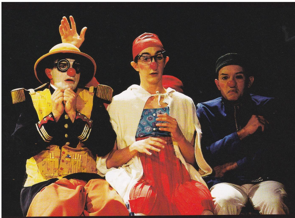
Les Nouveaux Nez, Mad ou Nomad , 2000, Pascal Jacob, Le cirque voyage vers les étoiles , Paris, GEO Solar, 2002.