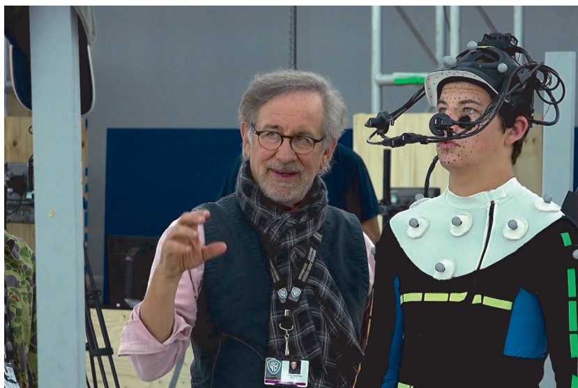
Photo de Steven Spielberg prise sur le tournage de Ready Player One .