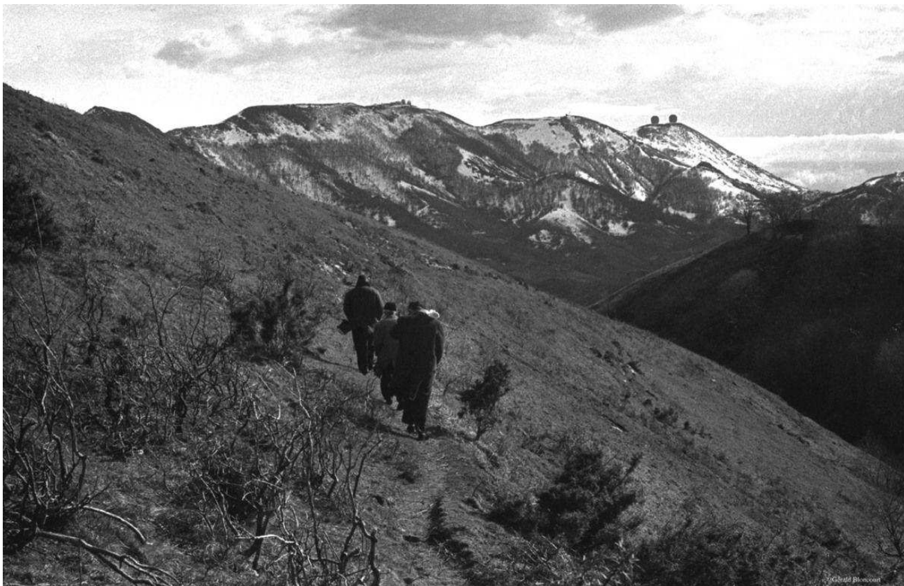
1097/14a- passage clandestin d'immigrés portugais à travers les Pyrenées - mars 1965