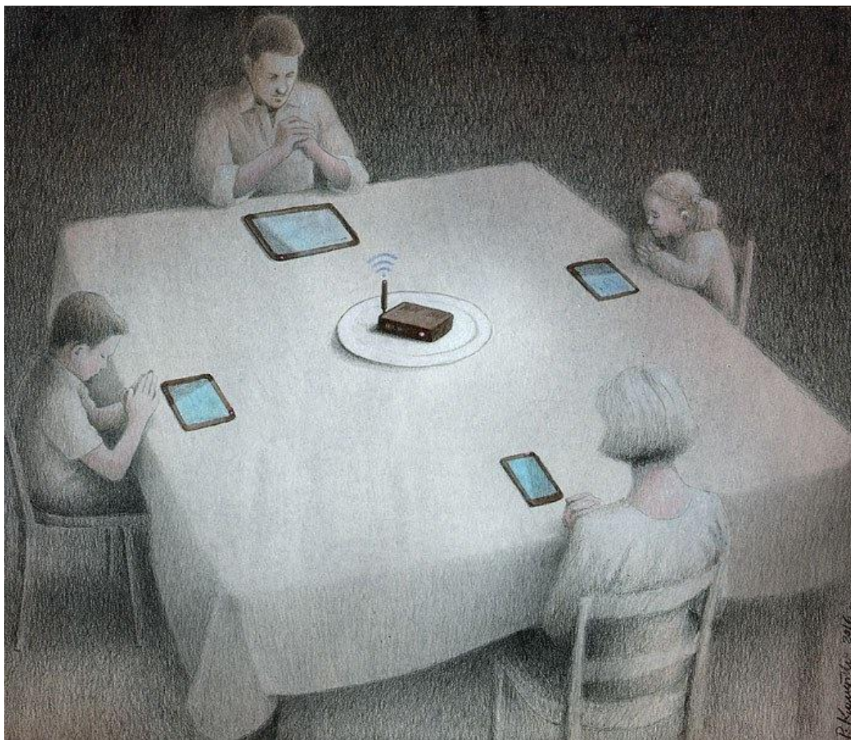
Grafika , „Rodzinna kolacja”, Paweł Kuczyński