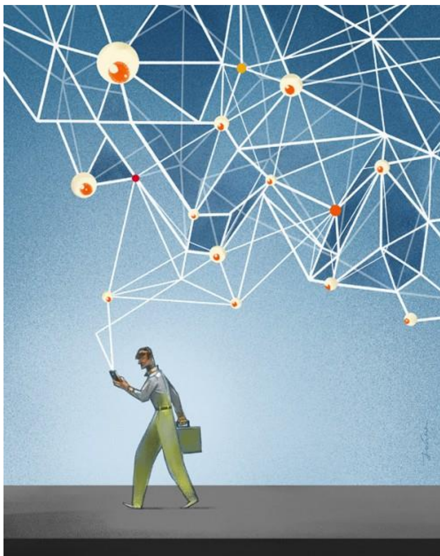
Ilustracja , „Wielki brat patrzy”, Paweł Jońca