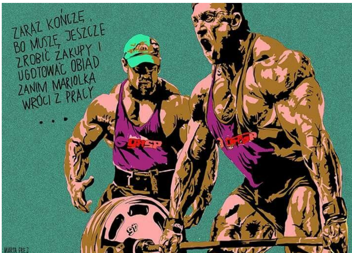
Źródło: Memy i grafy, Agnieszka Graff, Marta Frej