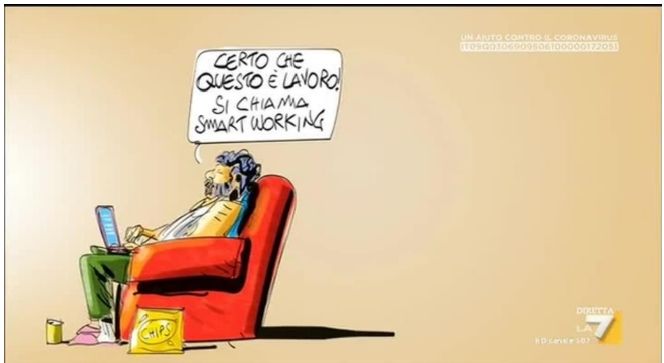
Makkok, la7.it , 2020