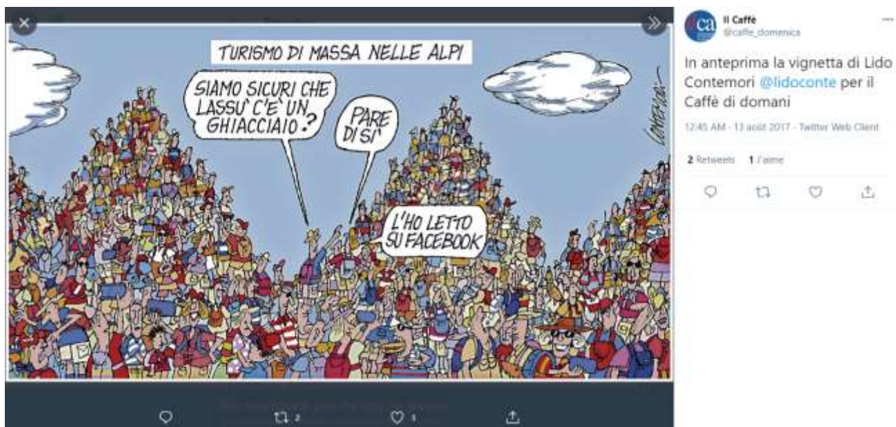
Il caffè, @Twitter-13 Agosto 2017