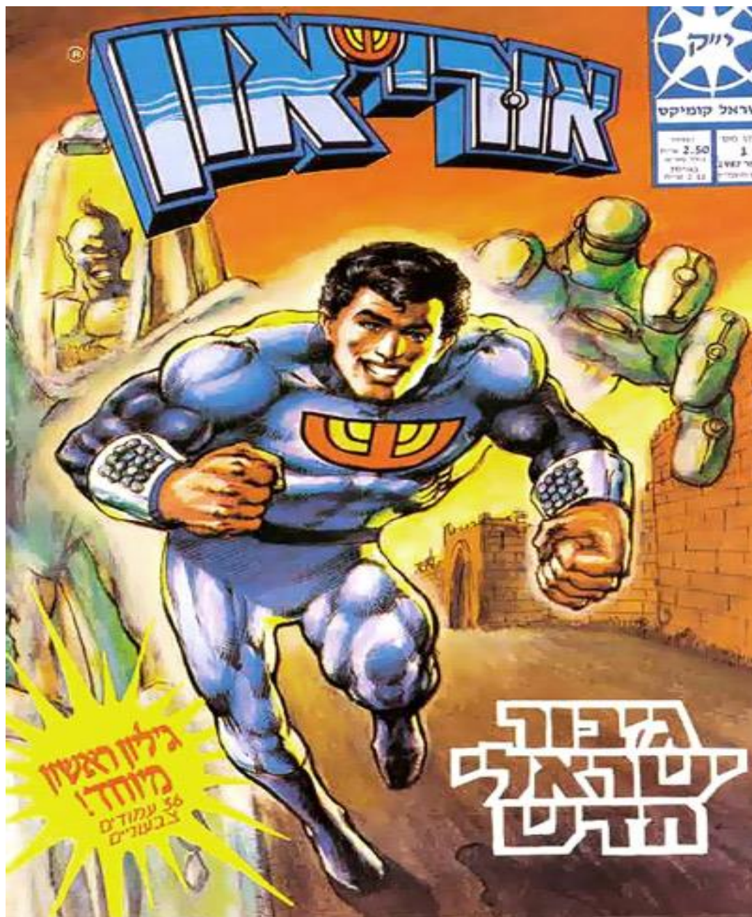
אורי-און הוא גיבור-העל השני של הקומיקס הישראלי. מיכאל נצר יצר אותו ב-1987.