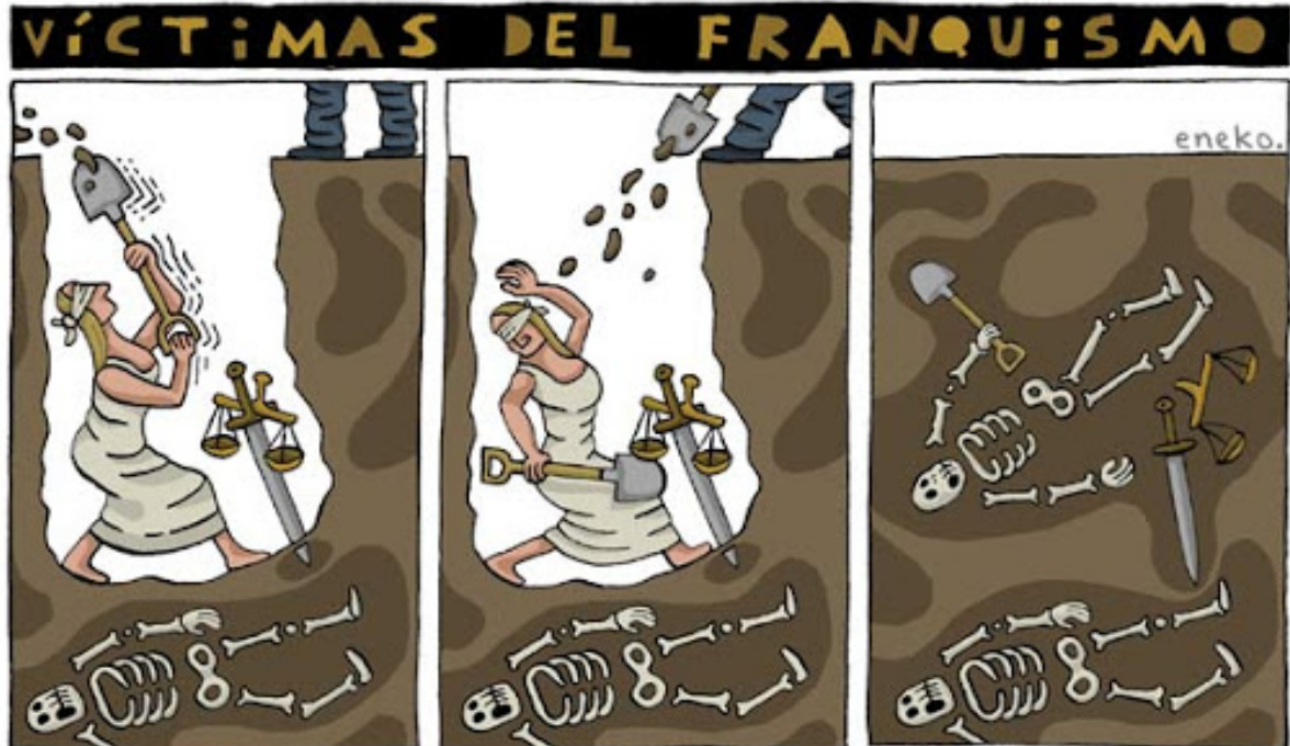
Eneko, La justicia también víctima del franquismo , 05/02/2010