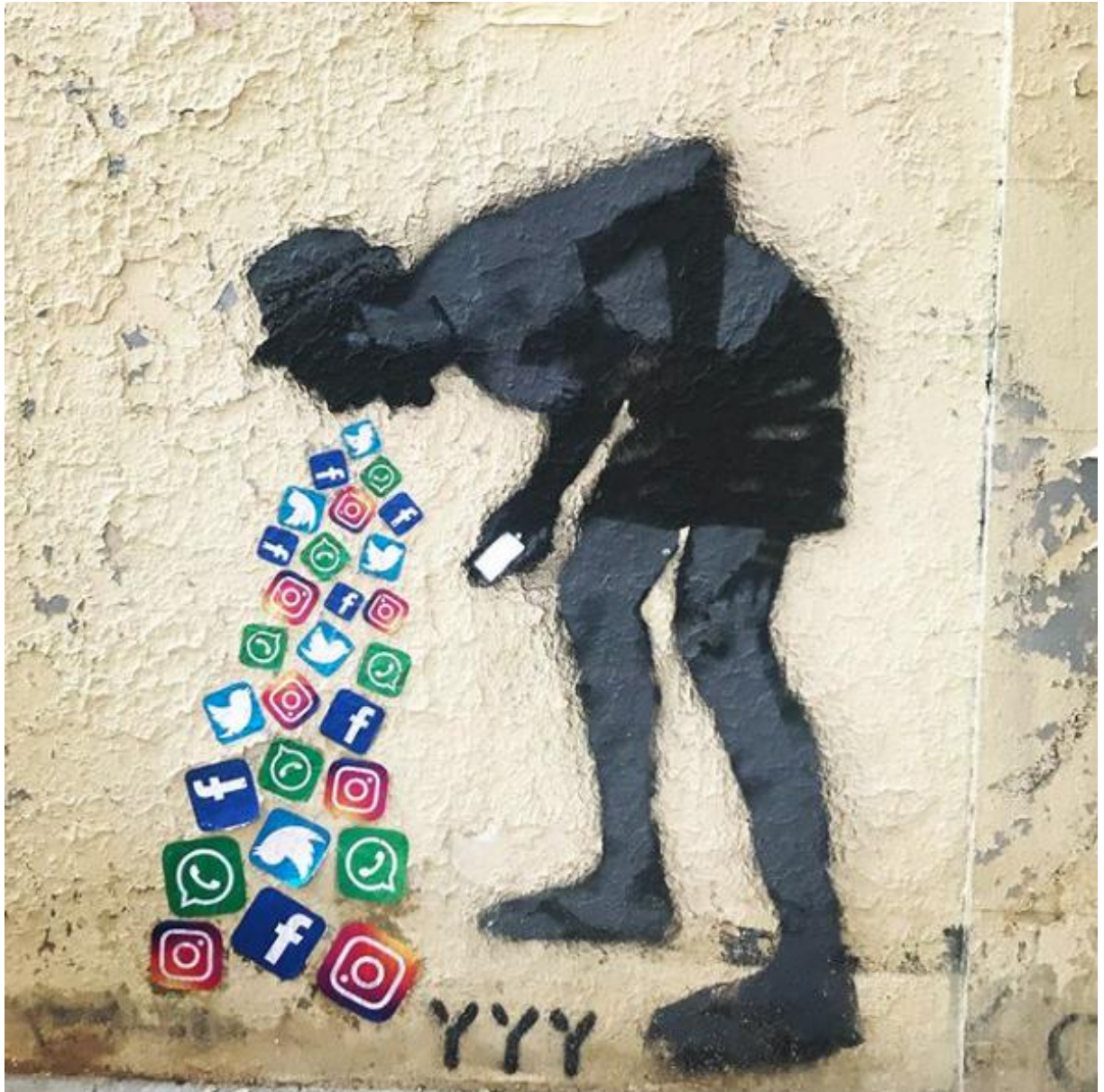
Intoxicación , colectivo « Yipiyipiyeah », Madrid, 28 de agosto de 2019