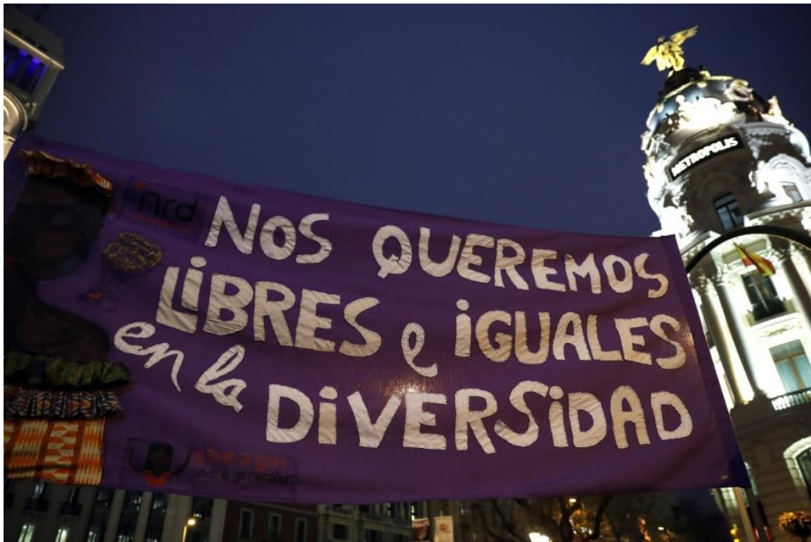
Manifestación 8M "Día de la mujer trabajadora", Madrid, 08/03/2018