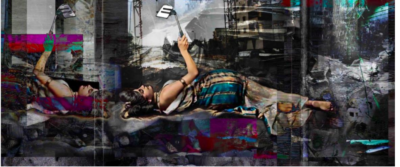
المشهد الثالث لمجموعة أعمال "بلاد الشام" للفنانة الأردنية غدير سعيد