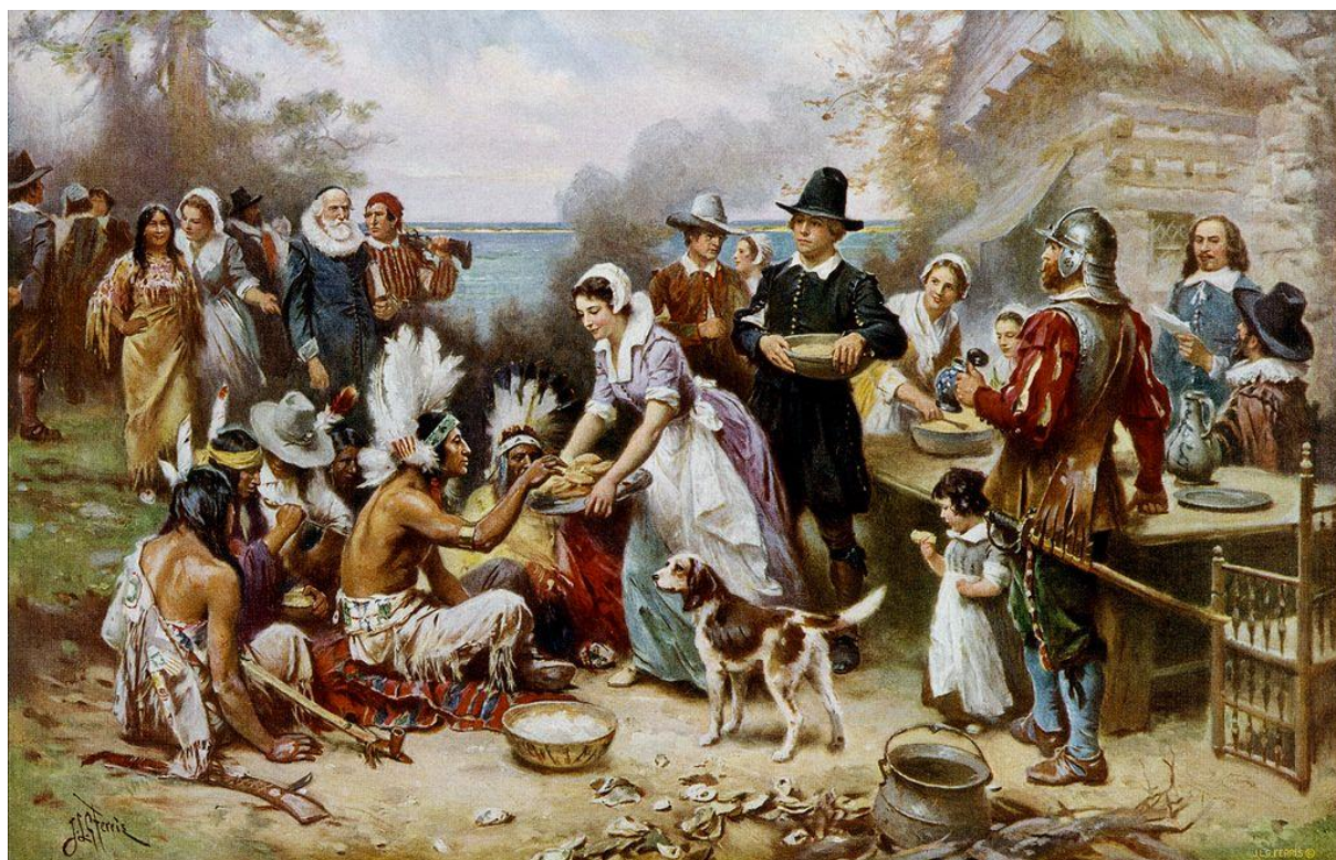
The First Thanksgiving in Massachusetts in 1621

Painting by Jean Leon Gerome Ferris (1863-1930), c. 1912-1915