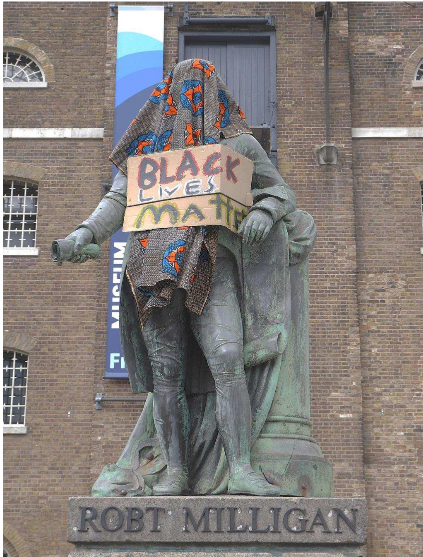
Statue of slave owner Robert Milligan West India Quay, London – June 9, 2020