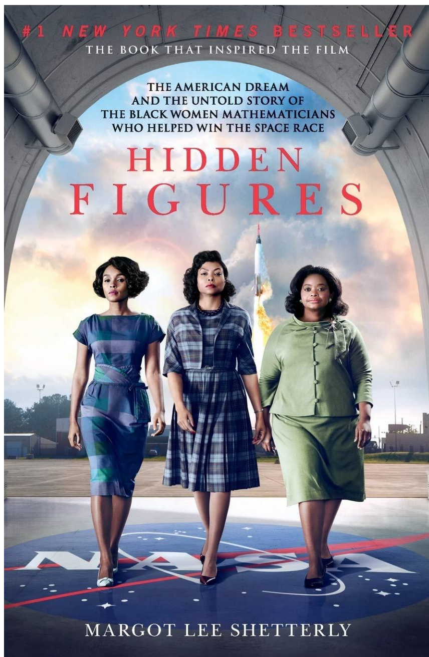
Book cover of Hidden Figures , Margot Lee Shetterly, 2016