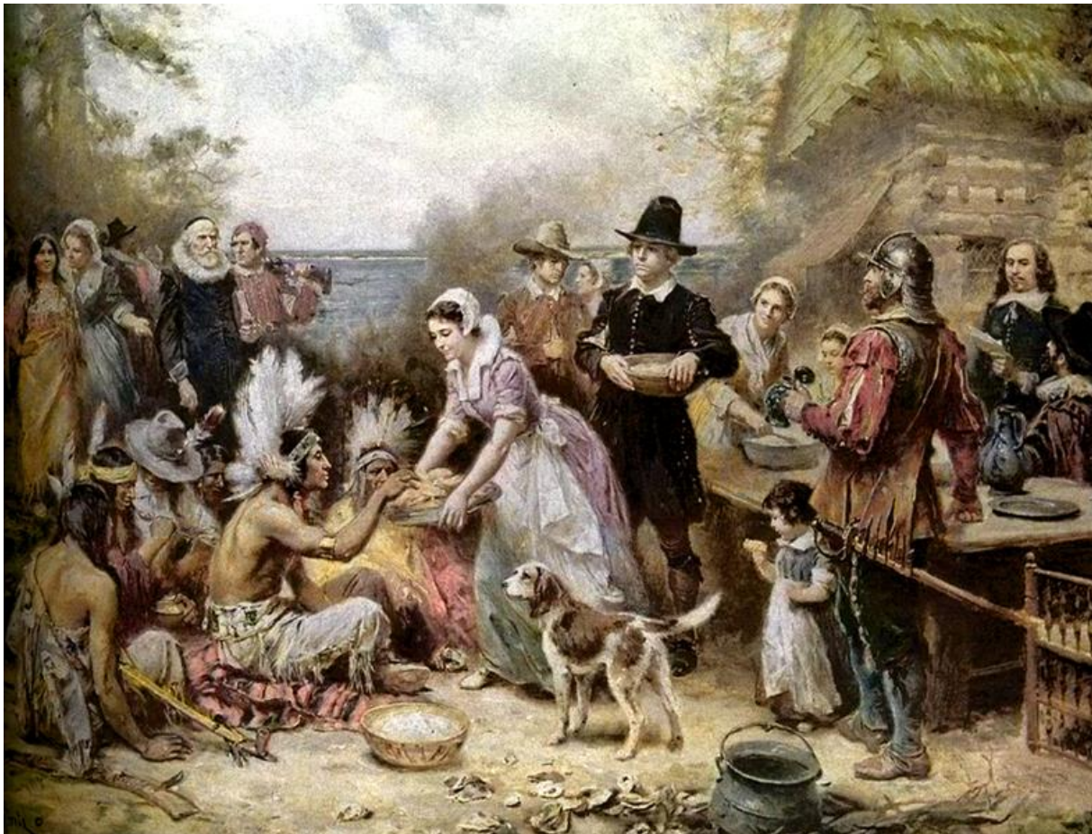
The First Thanksgiving 1621

Jean Leon Gerome Ferris (1863-1930), c. 1912-1915