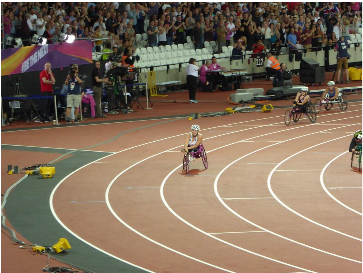
“Samantha Kinghorn wins Gold for GB”, World Para Athletics Championships, London 2017 | Photograph by Zeetha

https://www.flickr.com/photos/zeetha/35147191693/