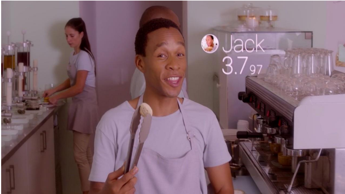
Screenshot from “Nosedive”, an episode of Black Mirror , a British science fiction television series