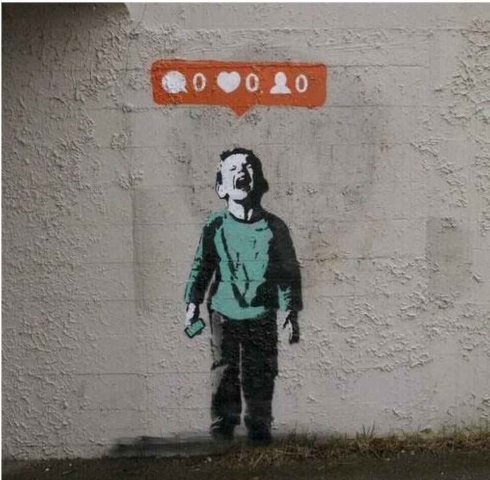
Nobody likes me , by iHeart, a Canadian street artist, Stanley Park, Vancouver, 2014