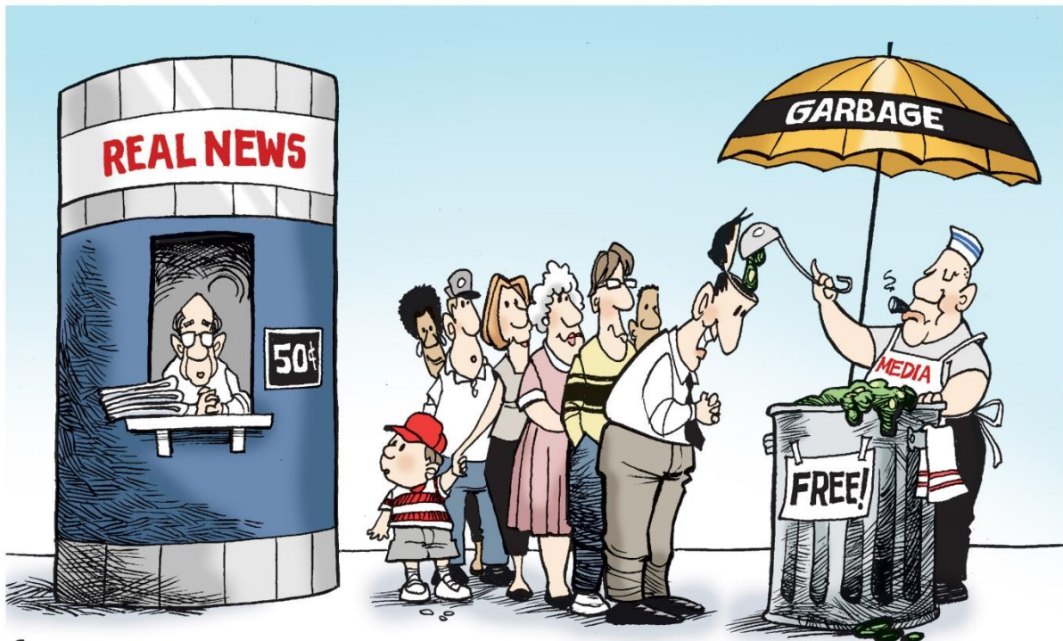
© Lisa Benson – August 24, 2016

Lisa Benson has been a cartoonist since 1992. Her cartoons, syndicated by the Washington Post Writers Group, appear in more than 100 newspapers in the United States and Canada.