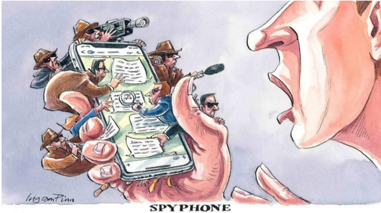
Cartoon by Ingram Pinn for The Financial Times Surveillance software infects smartphones , May 17, 2019