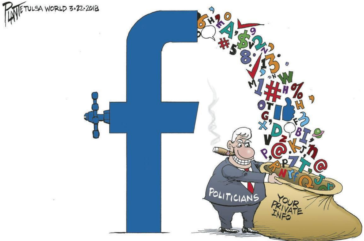
Cartoon by Bruce Plante, March 22, 2018

https://tulsaworld.com/opinion/columnists/bruce-plante-cartoon-facebook/article_3ac64dbb-f8f8-5b09-a8a3-b50135796212.html