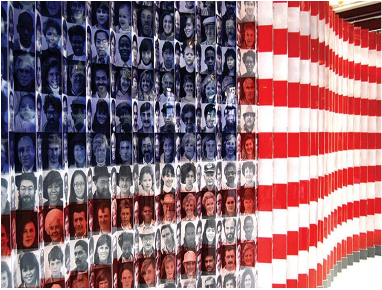
“American Flag of Faces” An American flag featuring the faces of immigrants on display at Ellis Island.

https://clas.berkeley.edu/research/immigration-economic-benefits-immigration http://clas.berkeley.edu/