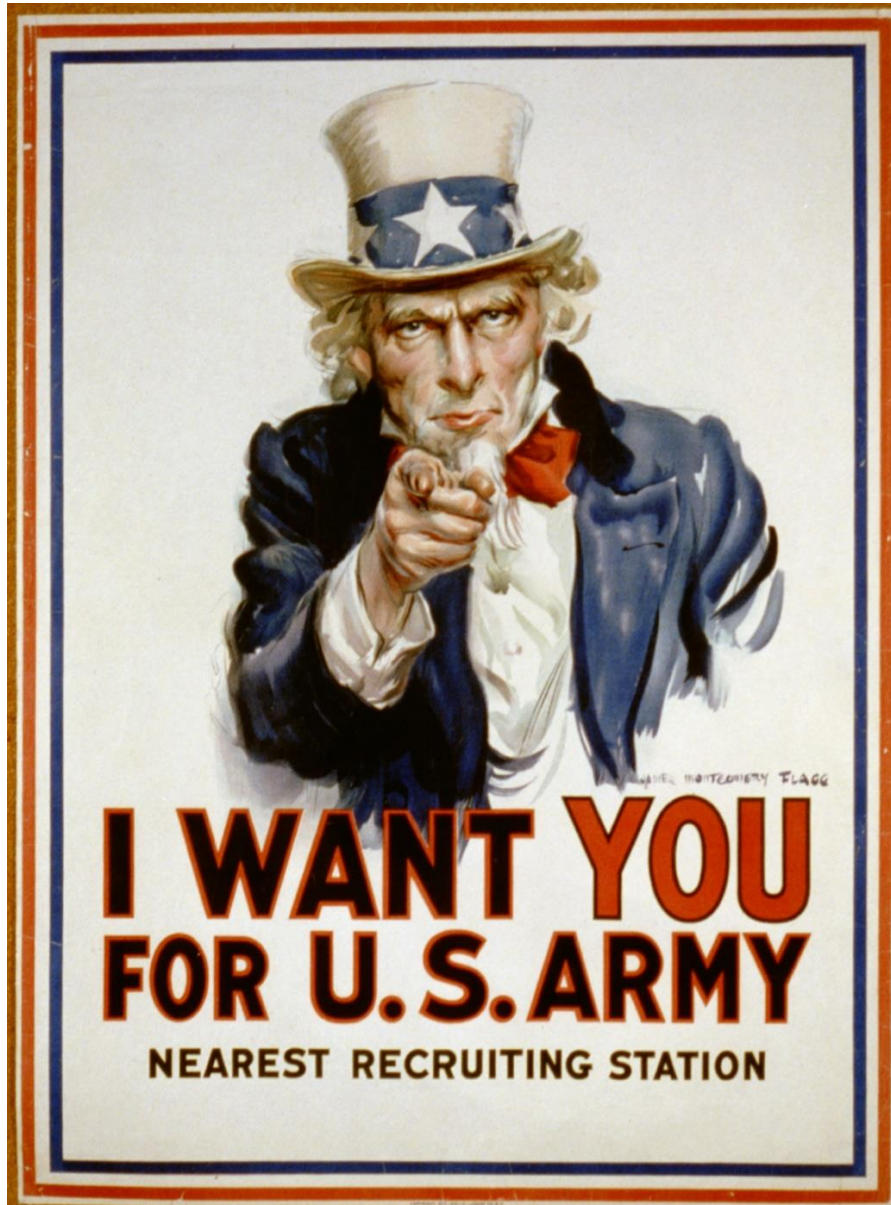
I want you for U.S. Army James Montgomery Flagg, 1917

https://fr.wikipedia.org/wiki/Fichier:I_want_you_for_U.S._Army_3b48465u_original.jpg