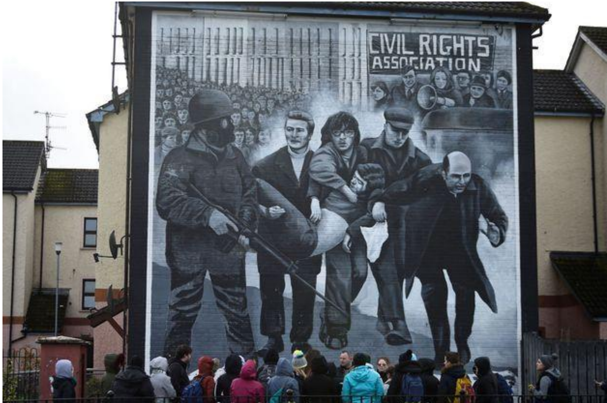
Tourists stand in front of a mural depicting the 1972 Bloody Sunday events, in Londonderry, Northern Ireland, March 14, 2019.