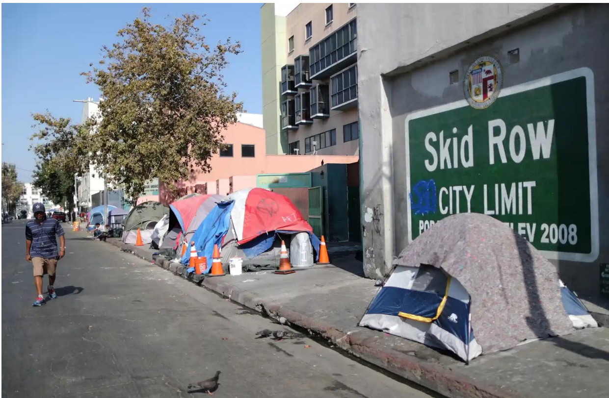
A man walks by the Skid Row area in Los Angeles, where there are many homeless encampments.