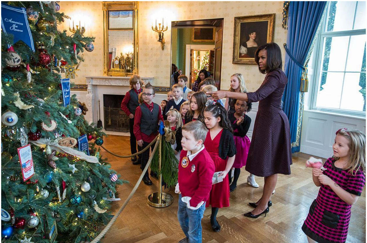
First Lady Michelle Obama stops to look at the White House Christmas tree in the Blue Room while walking with children of military families to the State Dining Room of the White House for a craft project during the Christmas holiday press preview, Dec. 3, 2014.