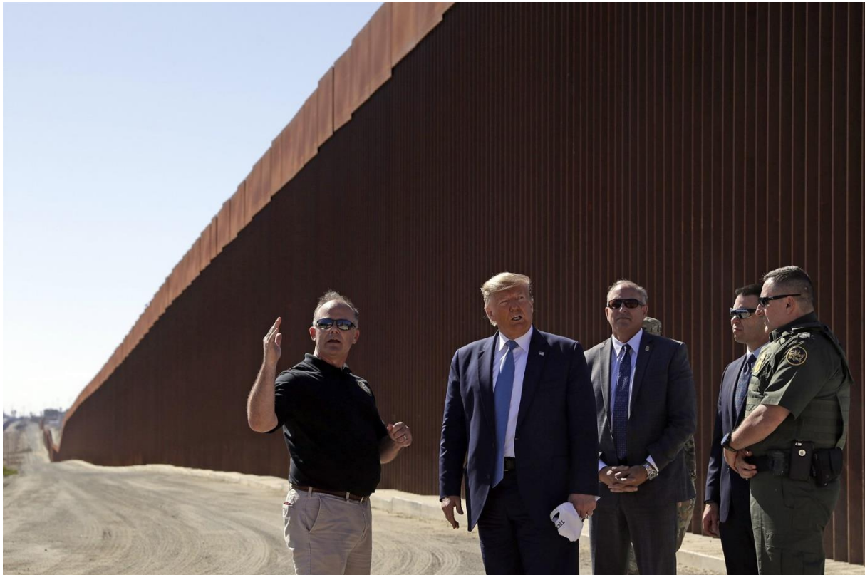
President Donald Trump tours a section of the southern border wall under construction on Sept. 18, 2019, in Otay Mesa, Calif.