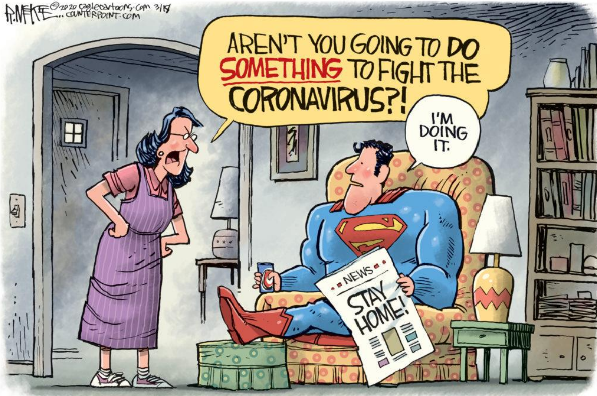
Published in The Augusta (Ga.) Chronicle , U.S., March 18, 2020 | By Rick McKee