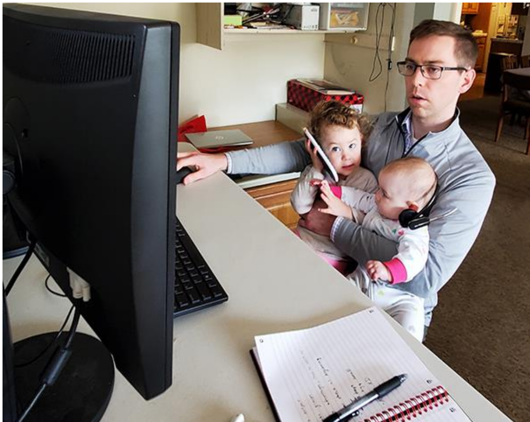
Photo illustration of the article “Will Today’s Covid-19-Prompted Teleworking Keep Working Tomorrow?” Civil Engineering – The Magazine of the American Society of Civil Engineers April 24, 2020

https://source.asce.org/will-todays-covid-19-prompted-teleworking-keep-working-tomorrow/