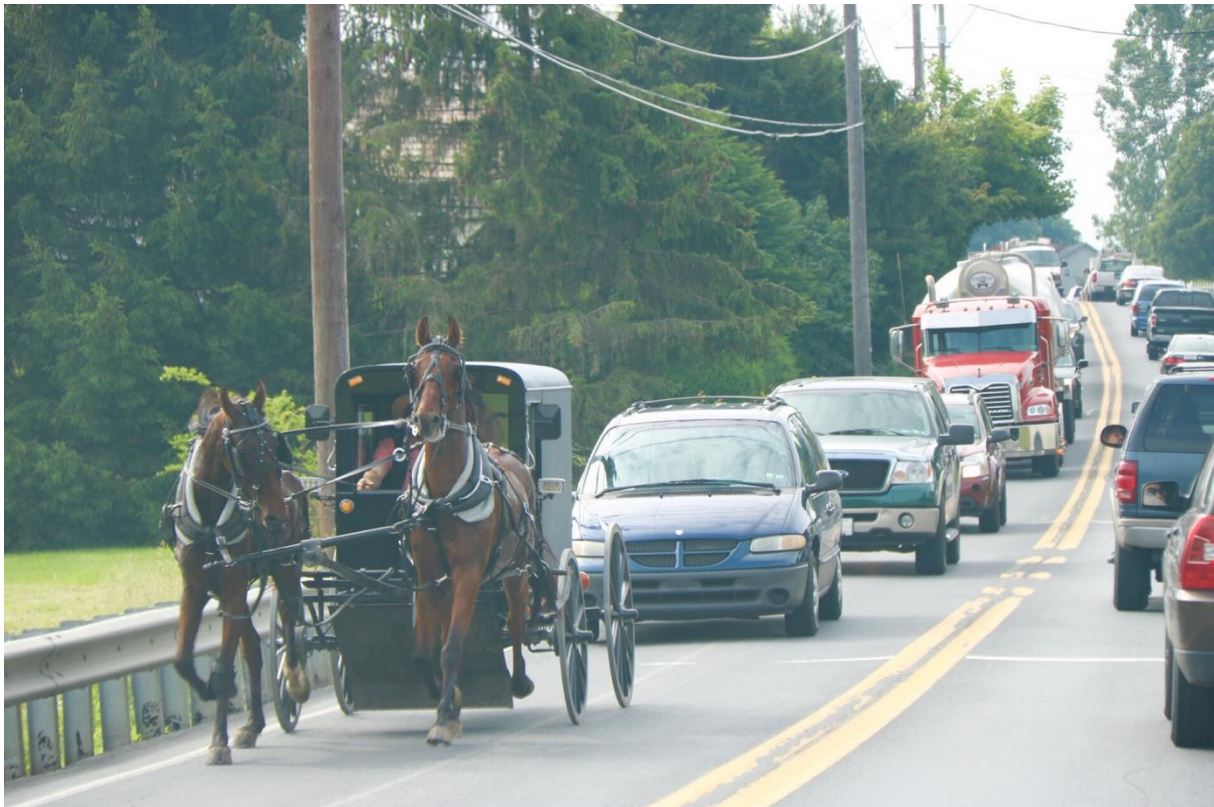
An Amish 1 buggy amid heavy traffic on a road in Lancaster County, Pennsylvania From the blog "Beeline Adventures": "Dinner in an Amish Home – Barefoot in the Barn" Photograph posted on June 6, 2017 http://kaijabeishline.com/2017/06/06/9722/