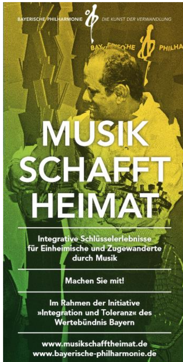
Plakat – Musik schafft Heimat, 2020

www.bayerische-philharmonie.de/Soziales-Engagement/