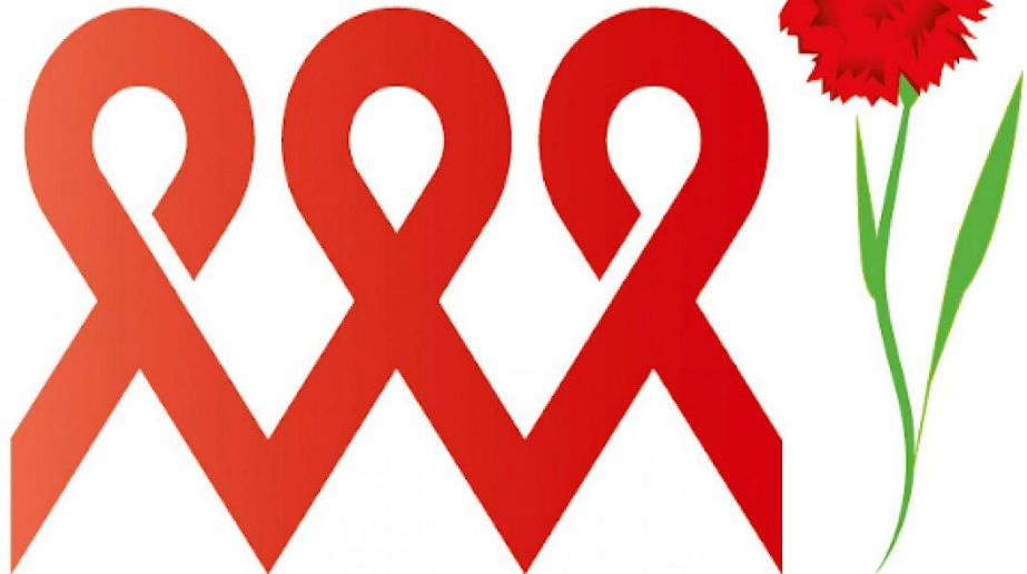
| Aktionskampagne zum 1. Mai „Mit HIV arbeiten? Na klar!“ – Gemeinsam gegen Diskriminierung und Vorurteile am Arbeitsplatz

„HIVUndArbeit Aktionskampagne zum 1. Mai, Mit HIV arbeiten? Na klar!“ – Gemeinsam gegen Diskriminierung und Vorurteile am Arbeitsplatz“