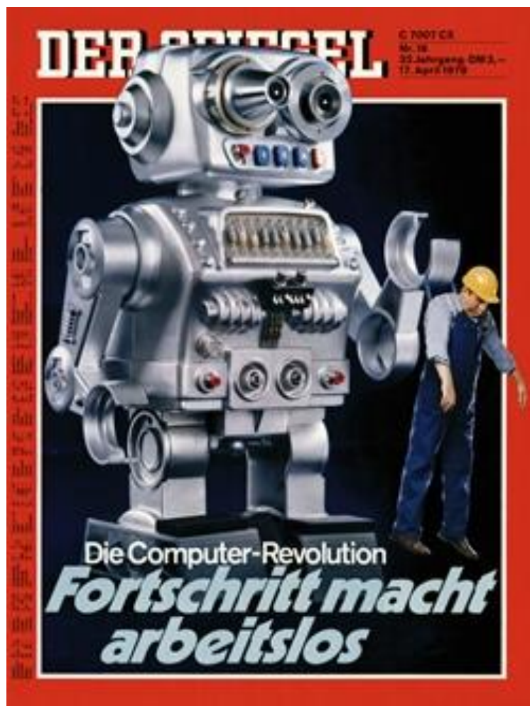
Titelseite – Die Computer-Revolution: Fortschritt macht arbeitslos – Der Spiegel, April 1978