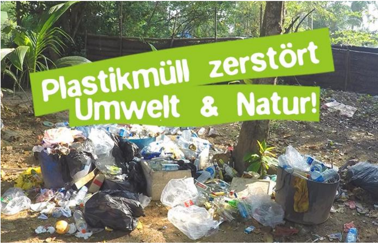
Foto aus der Webseite des Umweltschutzprojektes Careelite: „Plastikmüll zerstört Umwelt und Natur“