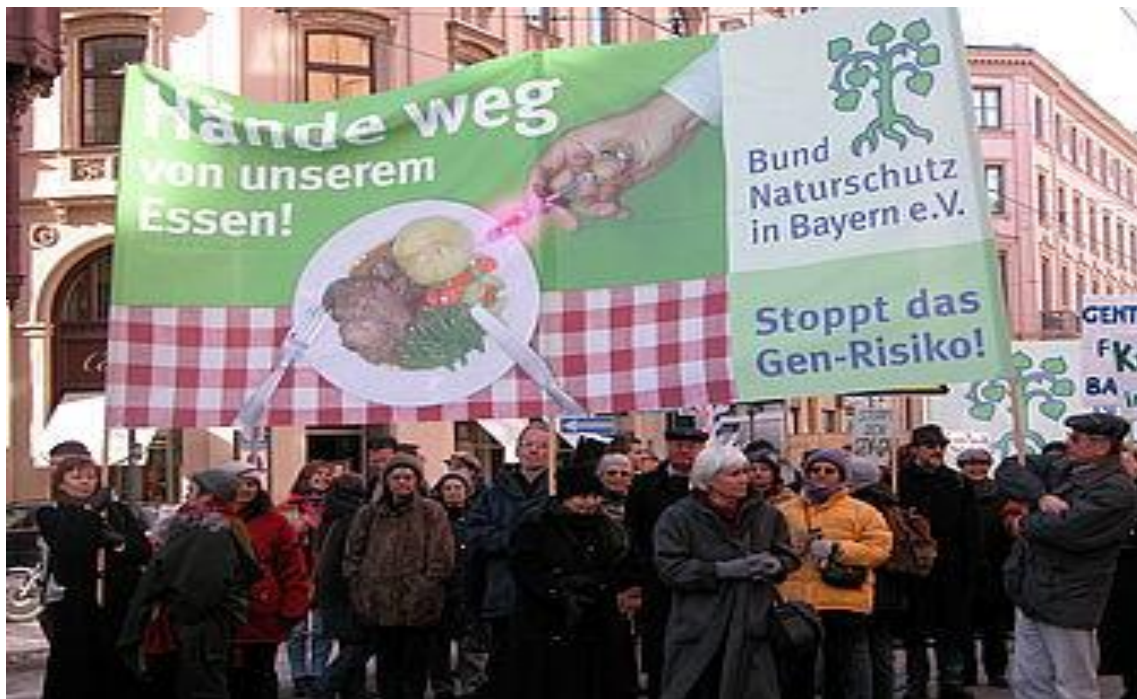
13.11.2019 – Demonstration in Bayern gegen den Anbau gentechnisch veränderter Pflanzen