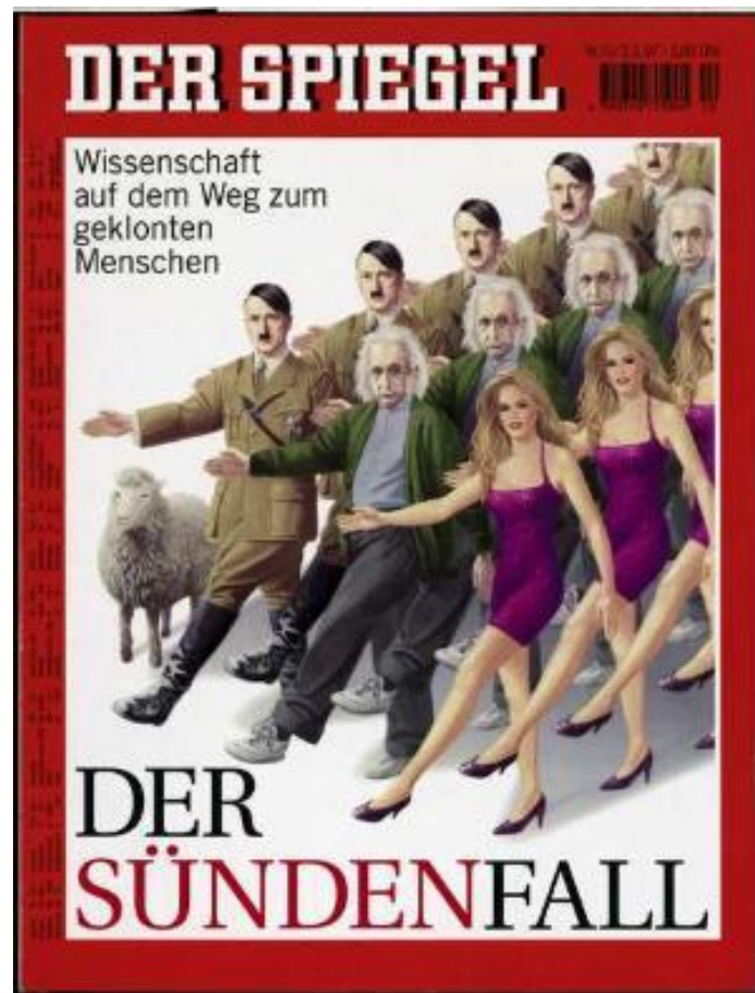
Titelseite – Der Spiegel – 03.03.1997 – Der Sündenfall – Wissenschaft auf dem Weg zum geklonten Menschen