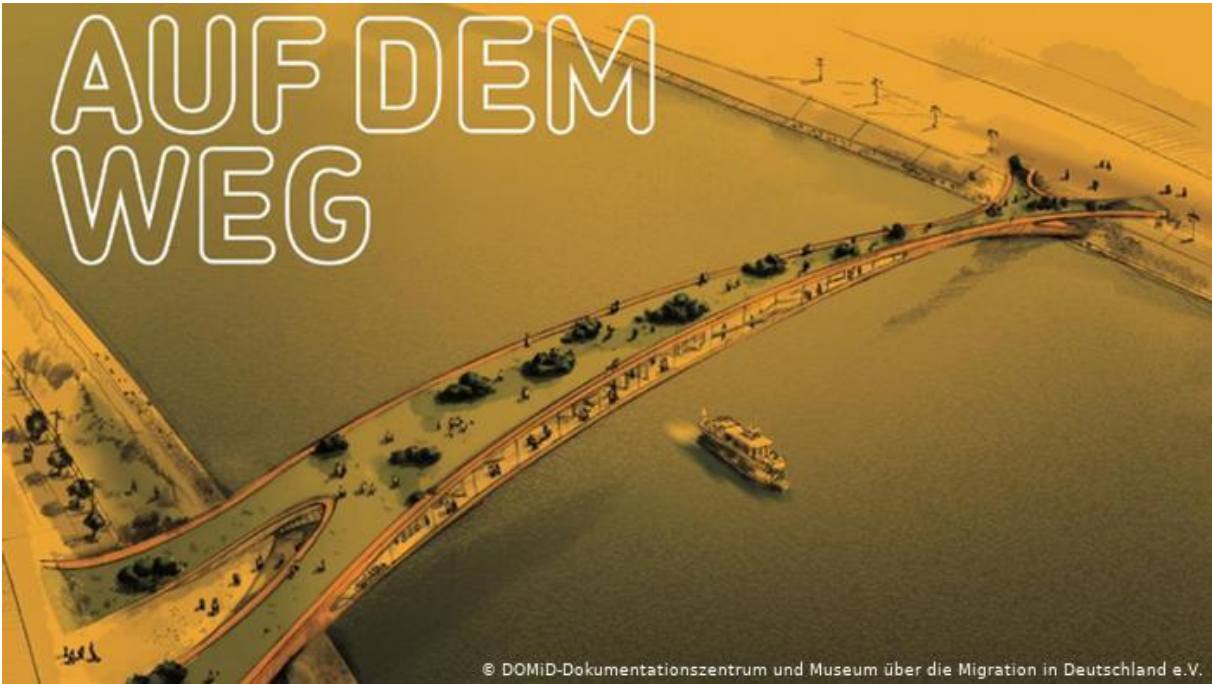
Zeichnung – Auf dem Weg , 2015 Ideen für ein zentrales Migrationsmuseum in Köln

Aus: DW, Dokumentationszentrum und Museum über die Migration in Deutschland