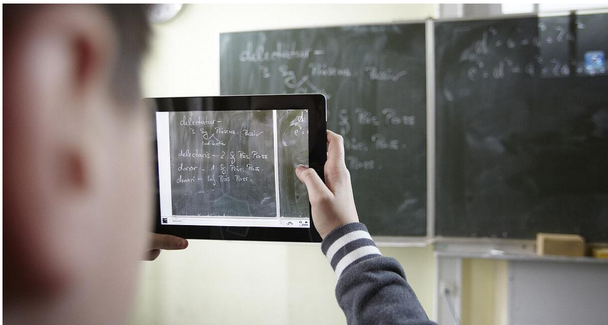
Foto – Digitalisierung an Schulen, Berlin, Juni 2020

Wie Schüler und Lehrer mit privaten Geräten die Corona-Krise meistern