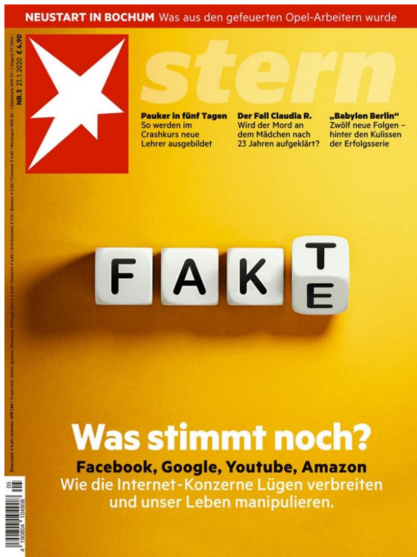
Aus : Titelblatt von der Wochenzeitschrift, Stern, Nr. 5 Januar 2020