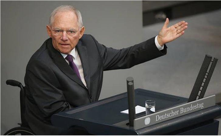
Zitat von Wolfgang Schäuble, deutscher Politiker (CDU), geboren 1942.

„Kann ein Land Zukunft haben, wenn es nicht an seine Zukunft glaubt, wenn die Familien schwächer werden, wenn die örtlichen Strukturen schwächer werden, wenn Vereine, Kirchen in ihren Bindungswirkungen nachlassen?“