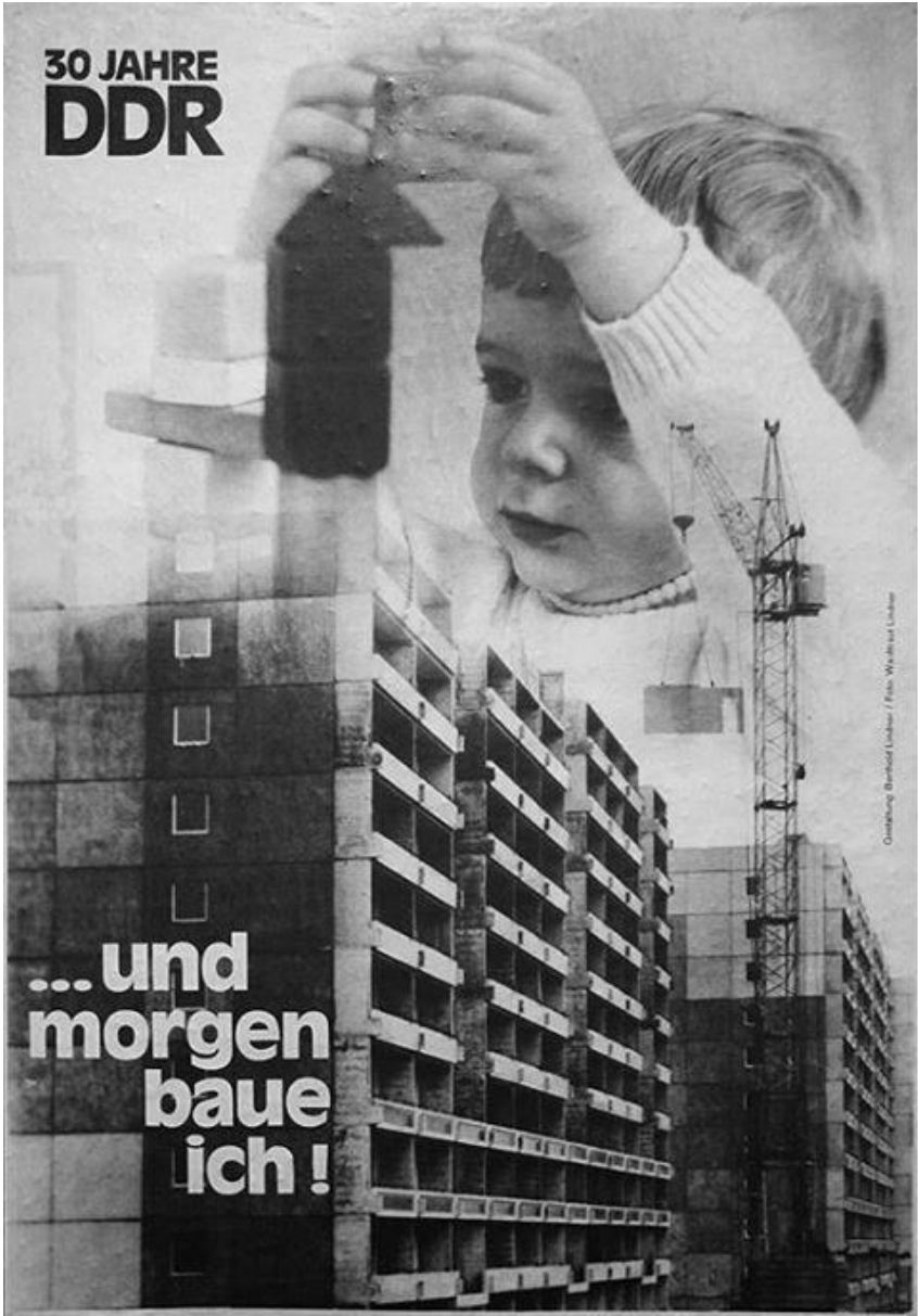
Plakat – DDR-Propaganda, 1979 Bau von Neubausiedlungen als politisches Projekt in den 70er und 80er Jahren