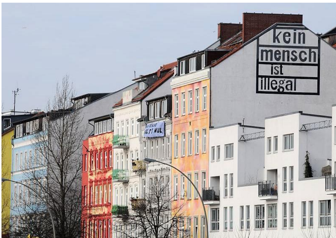
Foto – Street Art in Hamburg