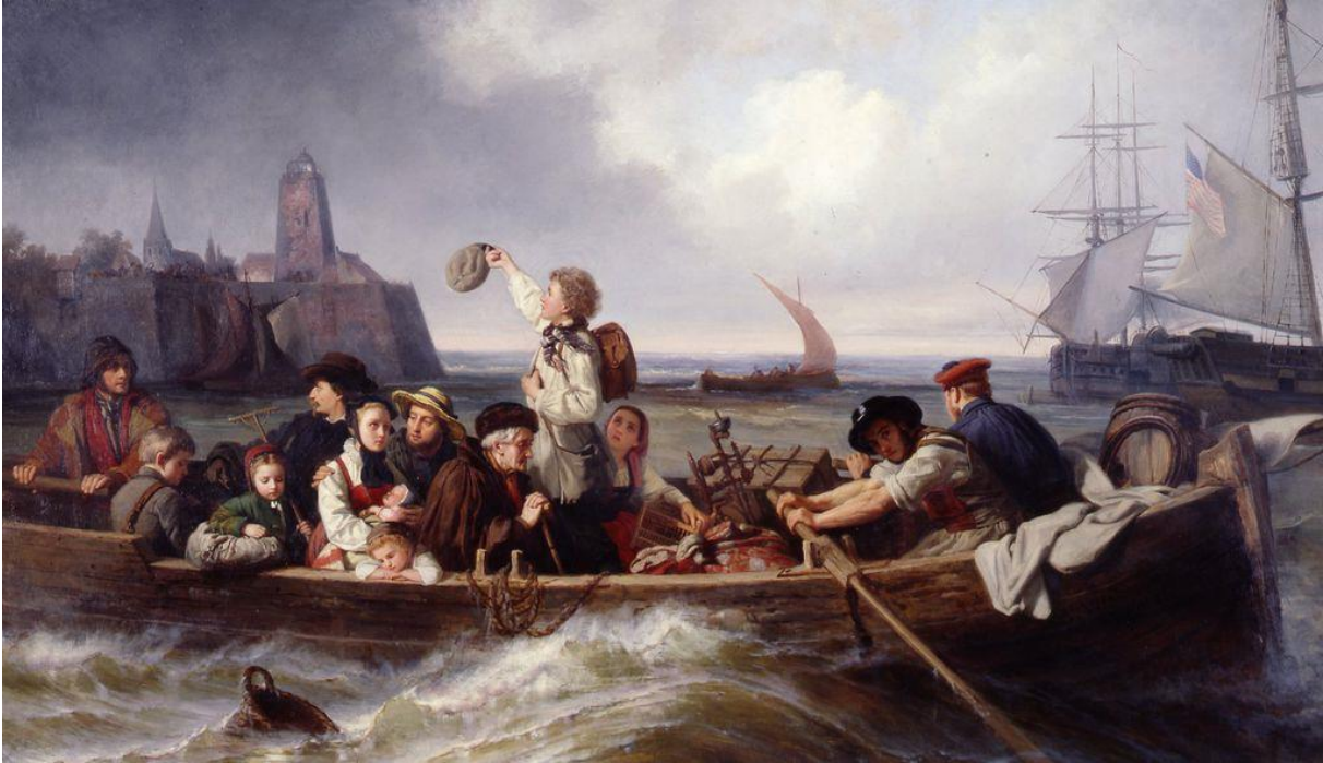
Gemälde von Antonie Volkmar, Abschied der Auswanderer , 1860