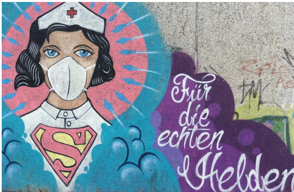
Foto – Street Art in Hamm