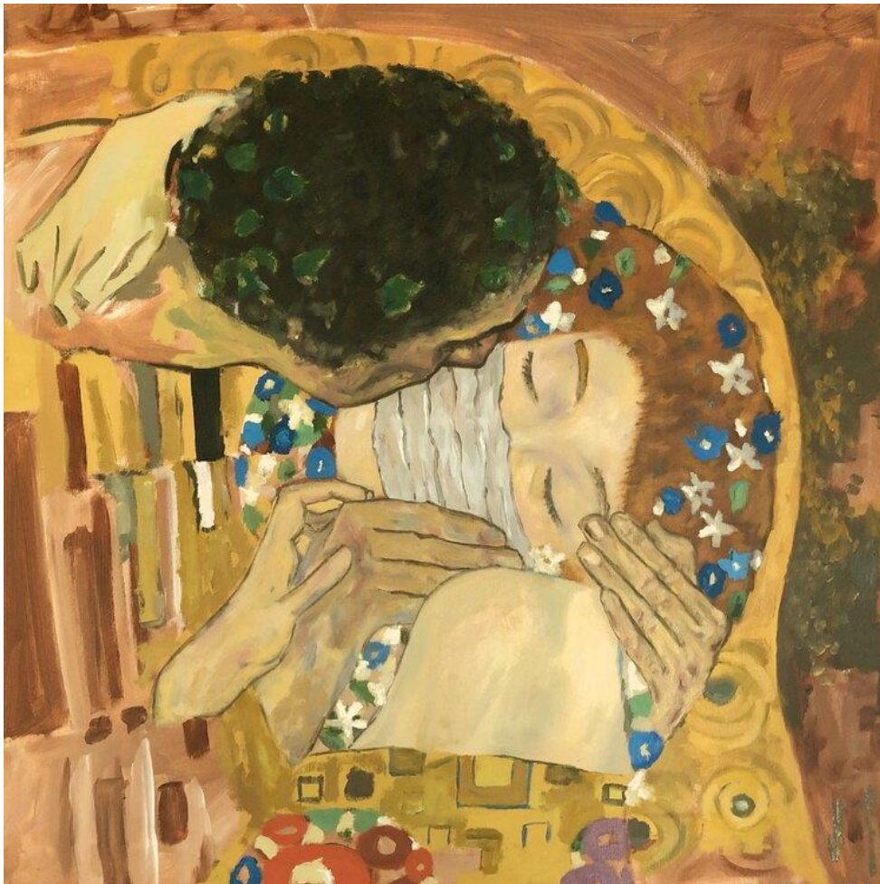
Gemälde – Moritz, JÄGER, „The Kiss 2020“, 2020