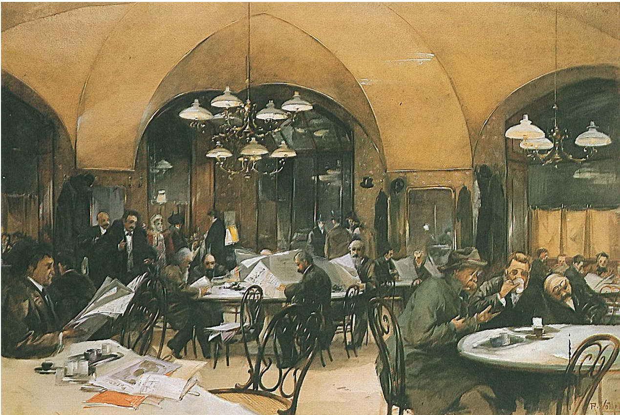
Gemälde von Reinhold Volkel, Café Griensteidl , Wien, 1896