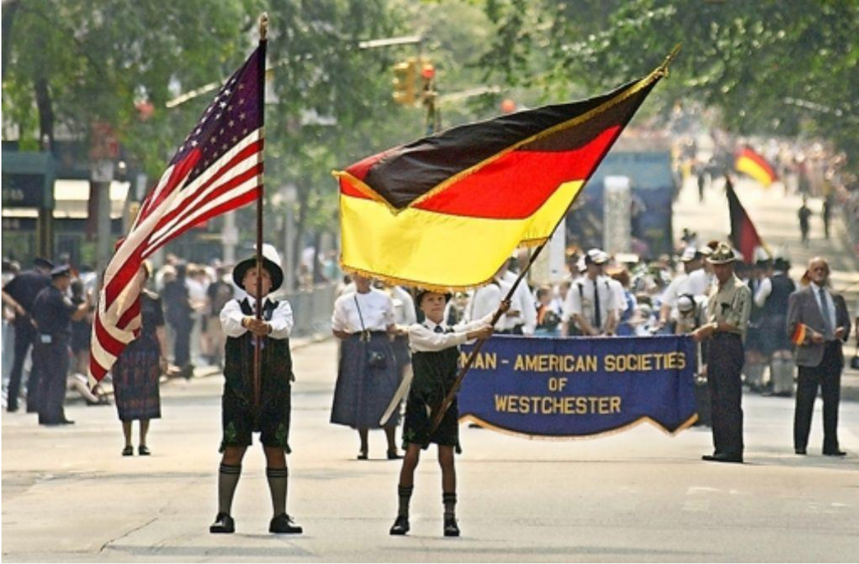
Foto – Steuben-Parade in New York

Tausende Menschen feiern einmal im Jahr die Steuben-Parade in New York. Tänzer und Musiker ziehen in deutschen Trachten durch die Straßen.